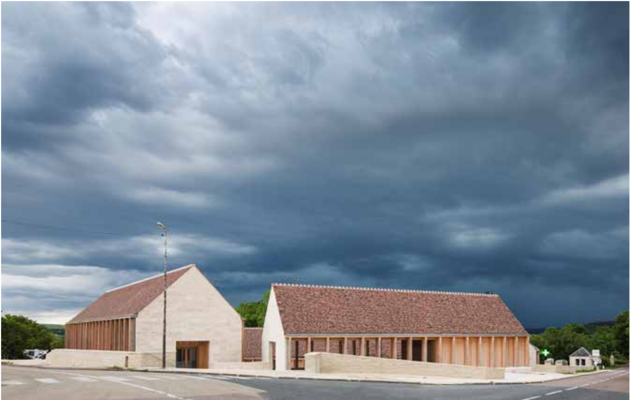
Maison de santé à Vézelay, BQ+A Bernard Quirot Architecte & Associés.