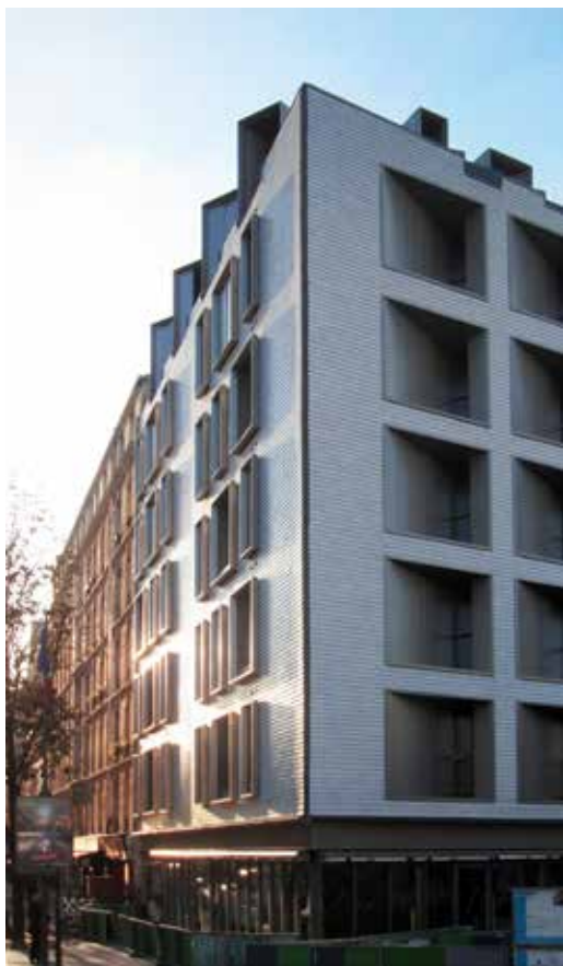
16 logements, Fresh Architecture, Grand Prix du jury 2014.