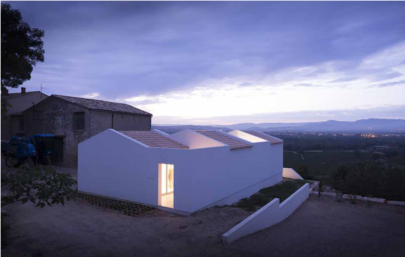
Maison de vacances dans la vallée de l'Hérault, Artelabo Architecture (nominé du palmarès 2016).