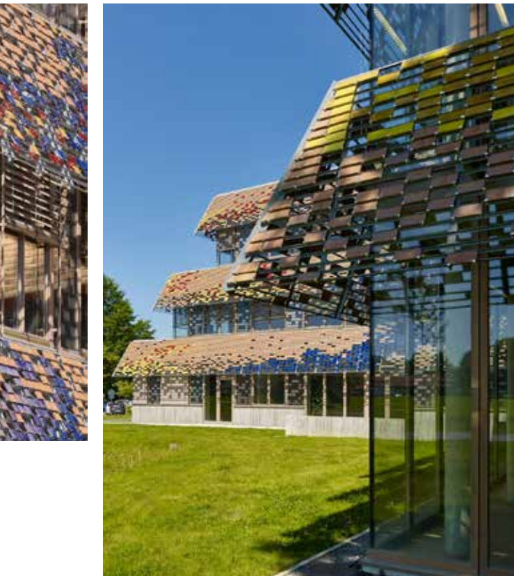
Extension et restructuration de locaux de recherche à Pau, Architecture Patrick Mauger (nominé du palmarès 2016).