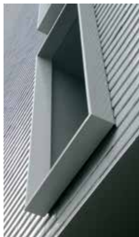
Villa Maddalena en Sardaigne, Jean-Yves Arrivetz architecte, Grand Prix du jury 2012.